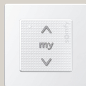
Smoove Origin io

Nadajnik radiowy do sterowania jednym lub kilkoma napędami. Możliwe sterowanie indywidualne, grupowe oraz centralne. Zasady doboru nadajników io do napędów io znajdują się na stronie 20.