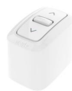
Inis Mounted Box