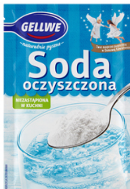
SODA OCZYSZCZONA GELLWE 70 g