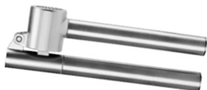
WYCISKACZ DO CZOSNKU