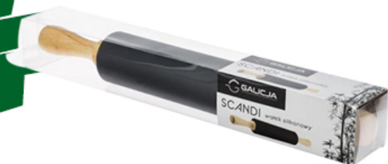
WALEK SILIKONOWY SCANDI