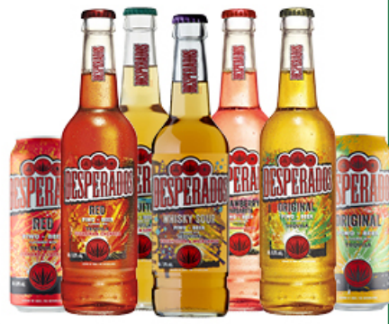
PIWO DESPERADOS 0,4 / 0,5 L