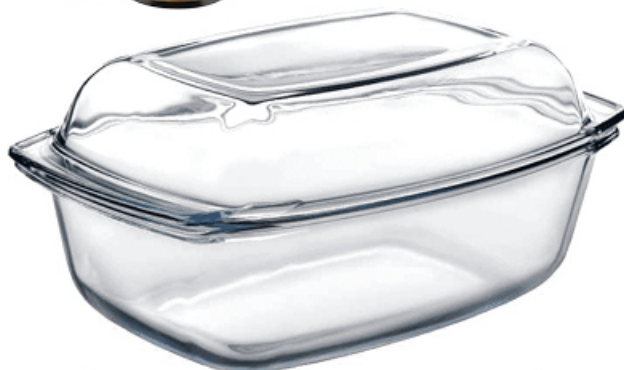
NACZYNIĘ ŻAROODPORNE TERMICA