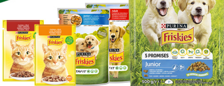
KARMA FRISKIES 85 / 100 / 500 g