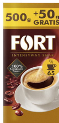
KAWA MIELONA FORT 500 g+50 g