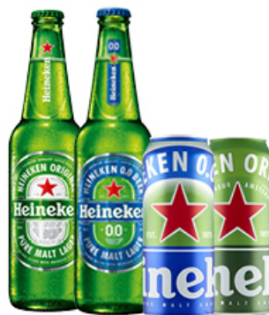
PIWO HEINEKEN 0,5 L