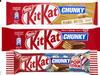
BATON KIT KAT 40 / 41,5 / 42 g WYBRANY ASORTYMENT NESTLÉ