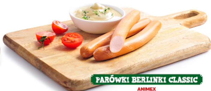
PARÓWKI BERLINKI CLASSIC