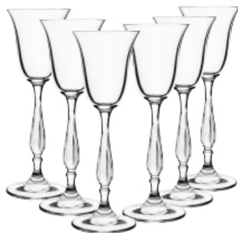
KIELISZKI TOSCANIA WÓDKA/LIKIER 60 ml 6 szt.