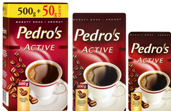
KAWA PEDRO'S ACTIVE 250 / 500 / 550 g