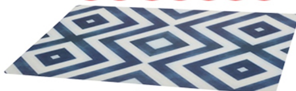
MATA NA STÓŁ LUXE 44,5 x 32 cm