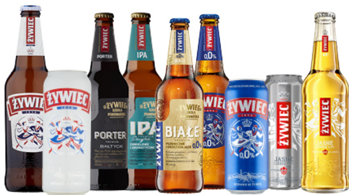
PIWO ŻYWIEC 0,4 / 0,5 L