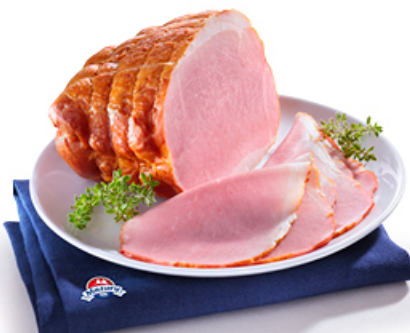
SZYNEK STAROPOLSKA MAZURY ELK