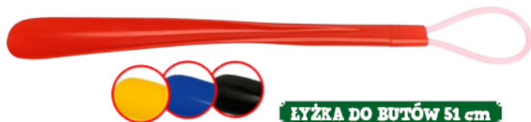
ŁYŻKA DO BUTÓW 51 cm