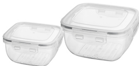
POJEMNIK KWADRATOWY FRESCO