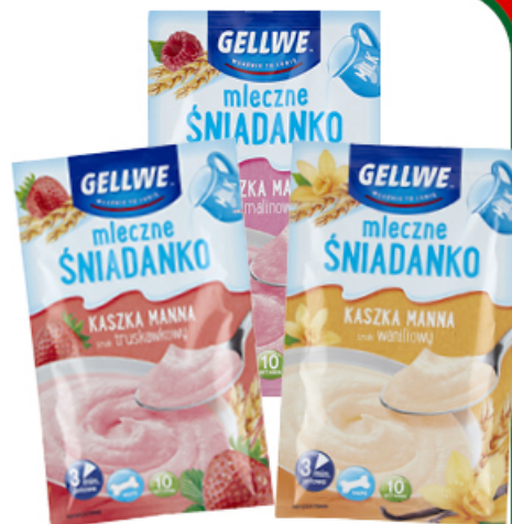
KASZKA MANNA GELLWE 50 g