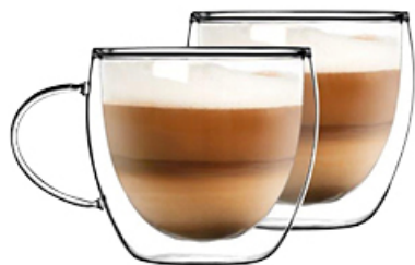
SZKLANKA Z UCHEM DUO