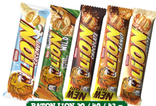
BATON LION 30 / 40 / 42 g WYBRANY ASORTYMENT NESTLÉ