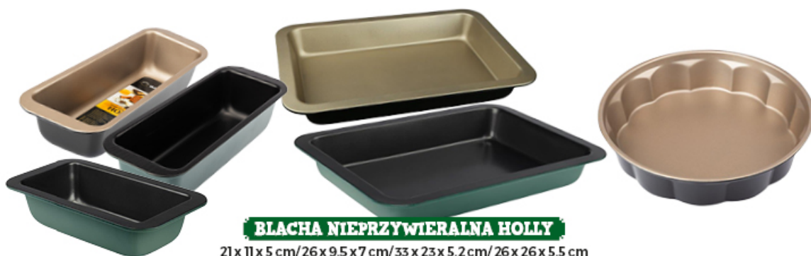
BLACHA NIEPRZYWIERALNA HOLLY

21 x 11 x 5 cm / 26 x 9,5 x 7 cm / 33 x 23 x 5,2 cm / 26 x 26 x 5,5 cm