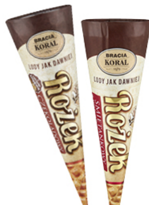
LODY JAK DAWNIEJ ROŻEK BRACIA KORAL 180 ml

WANILOWE, ŚMIETANKOWE, ŚMIETANKOWE Z CIASTECZKAMI, ŚMIETANKOWE Z WIŚNIAMI I SOSEM WIŚNI, BAKALIOWE KORAL