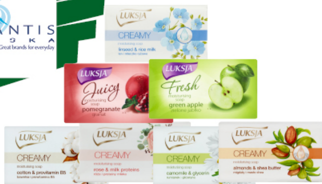
MYDŁO LUKSJA 90 g BAWEŁNA, LEN, MIGDAŁ, RÓŻA, RUMIANEK, FRUIT FRESH, FRUIT JUICY PZ CUSSONS

SARANTIS POLSKA Great brands for everyday