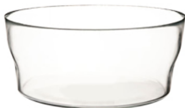
SALATERKA PROSTA śr. 19 cm