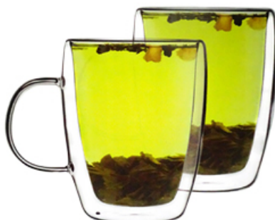
KUBEK DUO 270 ml 2 szt.