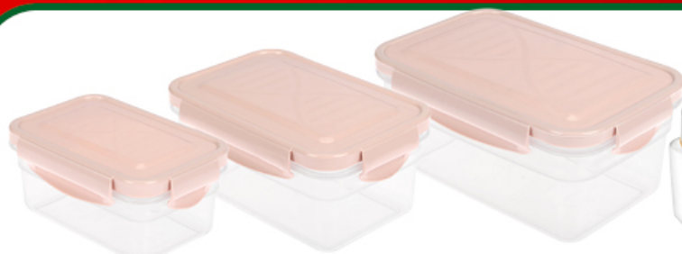
ZESTAW POJEMNIKÓW DO ŻYWNOŚCI