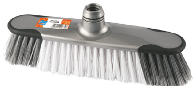
SZCZOTKA PLATINUM SILVER