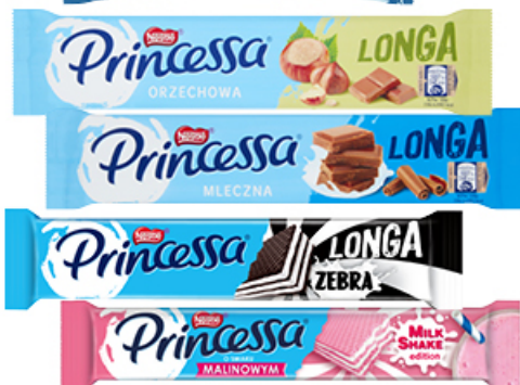
WAFEL PRINCESSA 30,5 - 46 g WYBRANY ASORTYMENT NESTLÉ