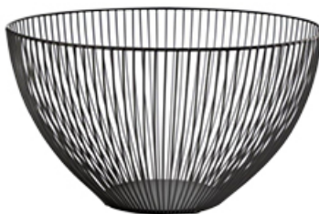
KOSZYK METALOWY TOGO