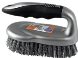
SZCZOTKA ŻELAZKO PLATINUM SILVER