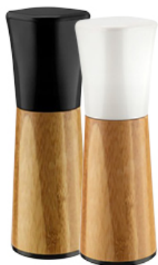
MEYNEK DO PIEPRZU/SOLI NODDY