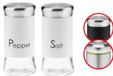
PRZYPRAWNIK SALT/ PEPPER GRENO