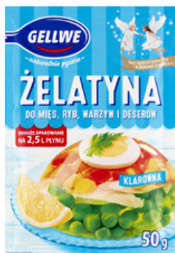
ŻELATYNA SPOŻYWCZA GELLWE 50 g