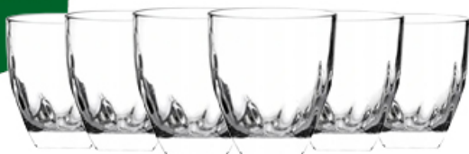
KOMPLET SZKLANEK NISKICH FALCO 6 szt.