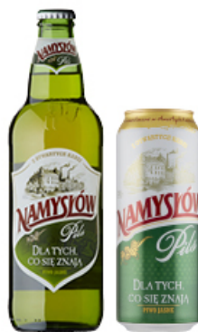
PIWO NAMYSŁÓW PILS 0,5 L