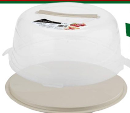
POJEMNIK OKRĄGŁY NA CIASTO MOLLY