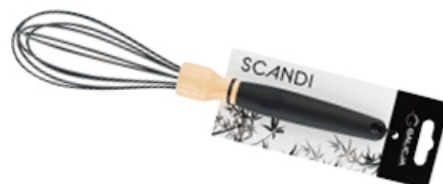
UBLJAK SILIKONOWY SCANDI