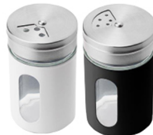
PRZYPRAWNIK ALCANO 90 ml