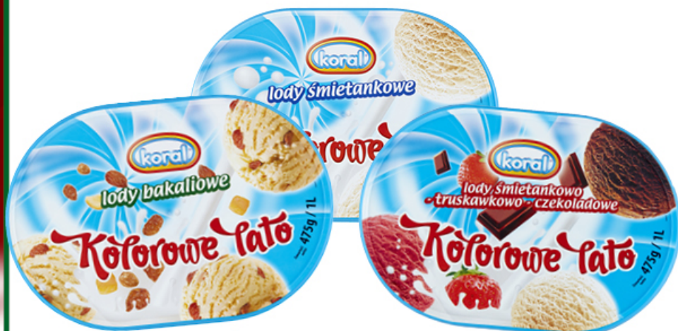
LODY KOLOROWE LATO 1 L

WANILIOWO-CZEKOLADOWE, ŚMIETANKOWE, BAKALIOWE, ŚMIETANKOWO-TRUSKOWO-CZEKOLADOWE KORAL