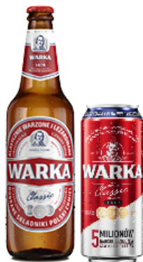
PIWO WARKA 0,5 L