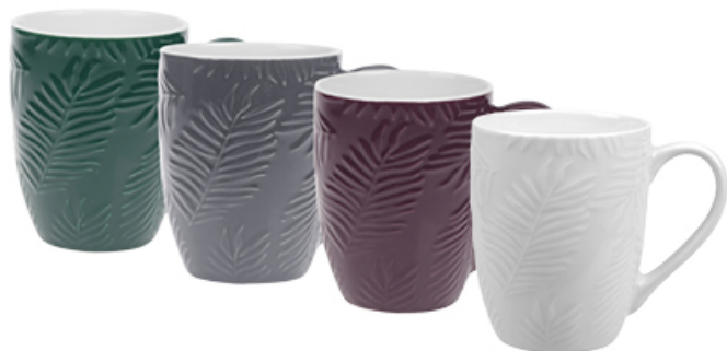
KUBEK LEAF Z PORCELANY NEW BONE 350 ml