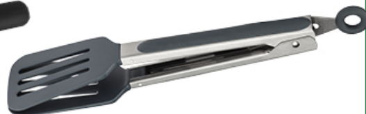
SZCZYPCE UNIWERSALNE PŁASKIE PRACTICO