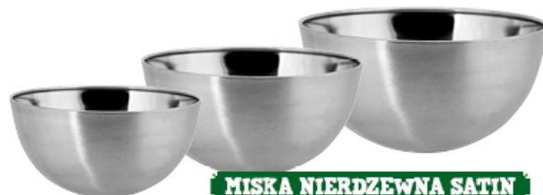
MISKA NIERDZEWNA SATIN