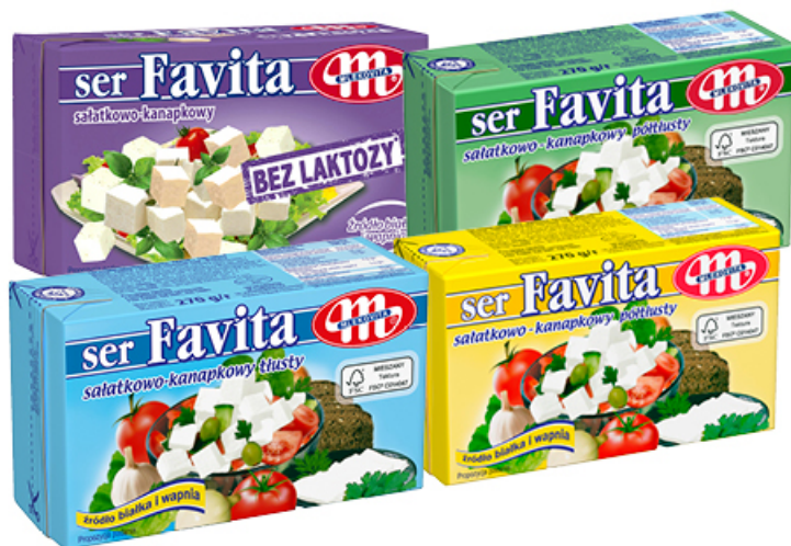
SER FAVITA 270 g 12%, 16%, 18%, BEZ LAKTOZY MLEKOVITA