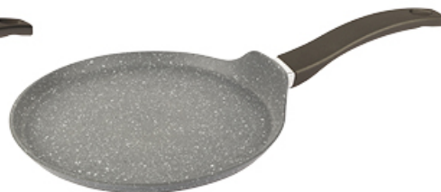
PATELNA DO NALEŚNIKÓW STONE 24 cm