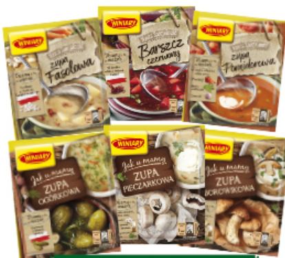
ZUPA WINIARY 40-80 g