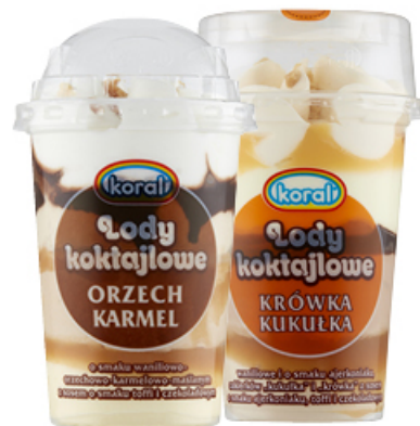
LODY KOKTAJLOWE 220 ml

WANILIOWO-CZEKOLADOWE, ŚMIETANKOWE, BAKALIOWE, ŚMIETANKOWO-TRUSKOWO-CZEKOLADOWE KORAL