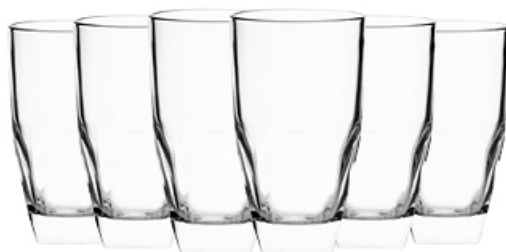
KOMPLET SZKLANEK WYSOKICH FALCO 6 szt.