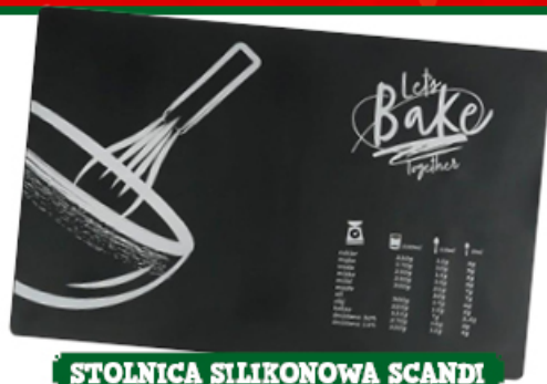
STOLNICA SILIKONOWA SCANDI