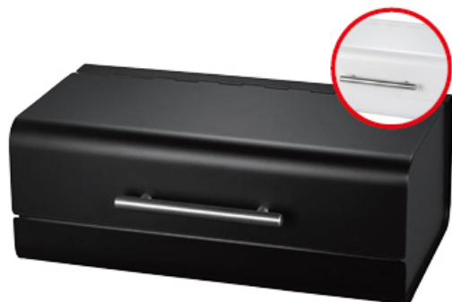
POJEMNIK NA PIECZYWO GRENO