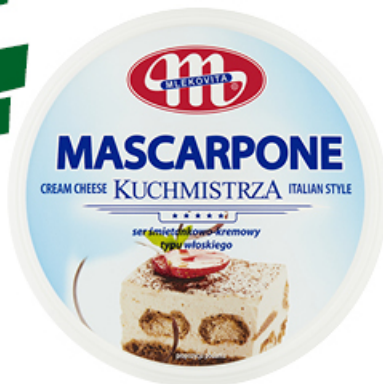
SEREK MASCARPONE KUCHMISTRZA 250 g