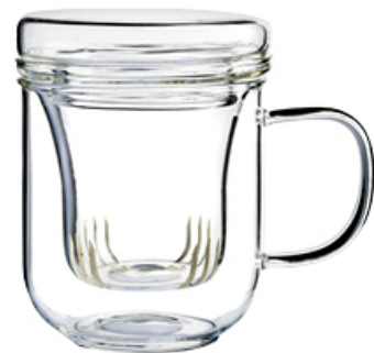
KUBEK Z ZAPARZACZEM MATTI 310 ml