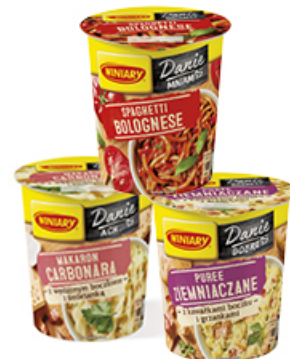
DANIE WINIARY 50 / 53 / 61 g