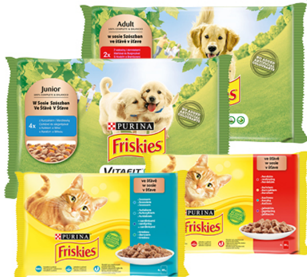
KARMA FRISKIES 1/2 x 85 / 1/2 x 100 g