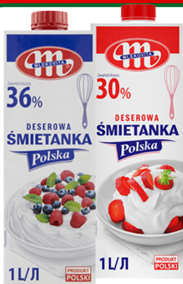
ŚMIETANKA POLSKA UHT 30 / 36% 1 L