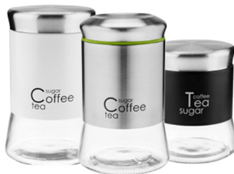
POJEMNIK SZKLANY GRENO BIAŁY/ CZARNY/ STAL