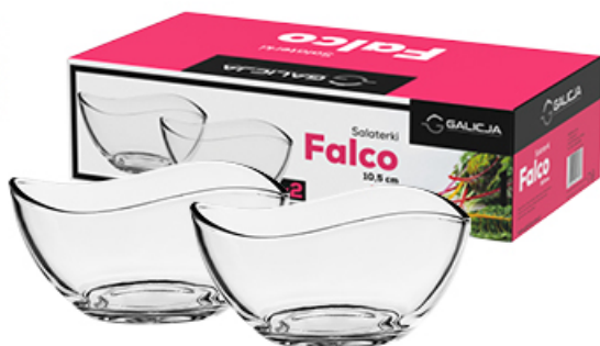
KOMPLET SALATEK FALCO 2 szt.