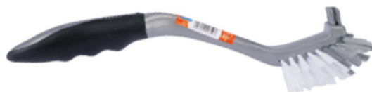
SZCZOTKA DO NACZYŃ DWUSTRONNA PLATINUM SILVER