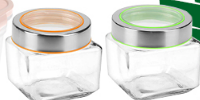
POJEMNIK SZKLANY SQUARE