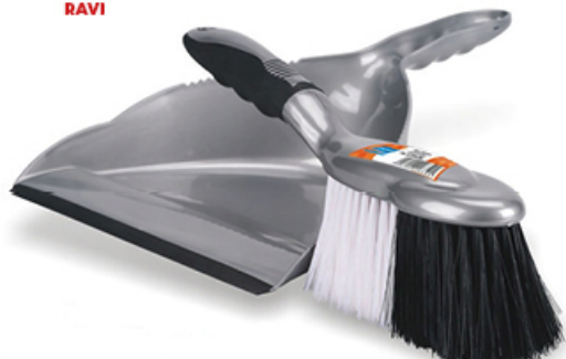
ZMIOTKA Z SZUFELKĄ PLATINUM SILVER