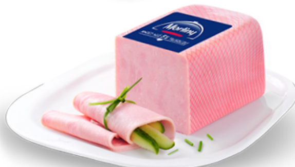
SZYNKA KONSERWOWA MORLINY