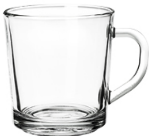
KUBEK EDIT 250 ml