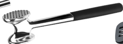
TŁUCZEK DO MIĘSA PRACTICO