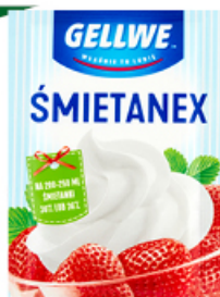
ŚMIETANEX GELLWE 12 g