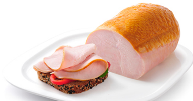
PIERŚ OPIEKANA Z INDYKA