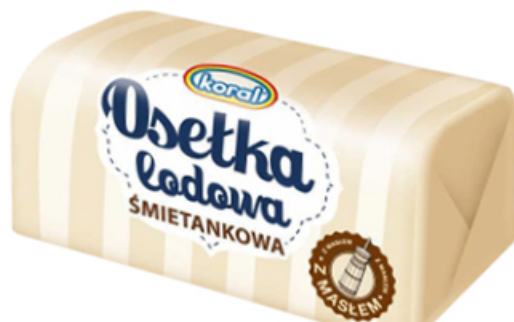
LODY OSEŁKA ŁODOWA 400 ml

WANILIOWY W MLECZNEJ CZEKOLADZIE, ŚMIETANKOWO WANILIOWY KORAL