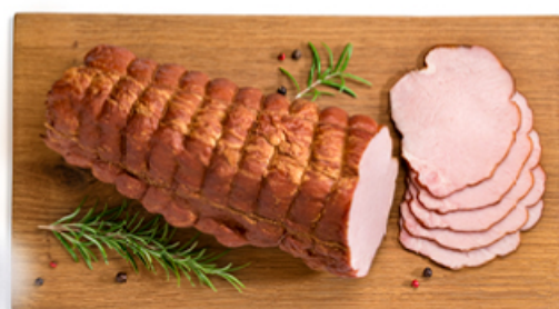
SCHAB STAROPOLSKI MAZURY ELK