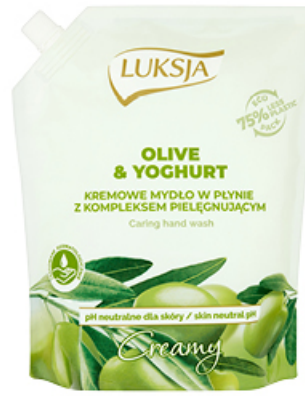
MYDŁO W PŁYNIE CREAMY LUKSJA 900 ml JASMINE & VANILLA, OLIVE & YOGHURT, COTTON MILK & VITAMINS PZ CUSSONS