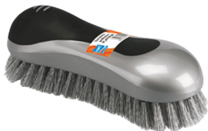
SZCZOTKA PODŁUŻNA PLATINUM SILVER