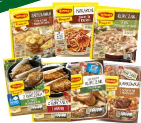
FIX POMYSŁ NA... WINIARY 23 - 44 g