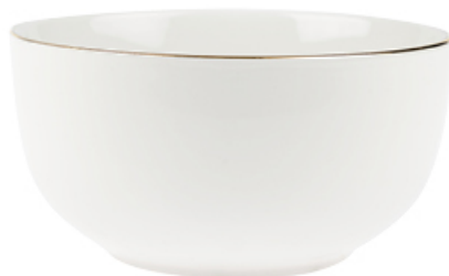
MISECZKA ORO Z PORCELANY NEW BONE 550 ml