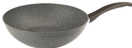
PATELNA WOK STONE 28 cm