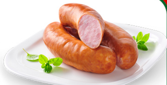
KIELBASA MORLIŃSKA MORLINY