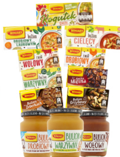
BULION WINIARY 60 - 180 g