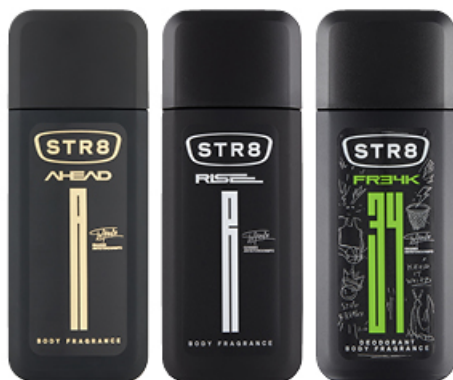
DEZODORANT STR8 75 ml