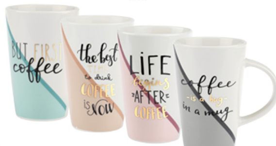
KUBEK MOTTO Z PORCELANY NEW BONE 420 ml