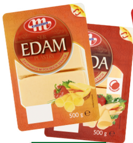
SER PŁASTRY 500 g