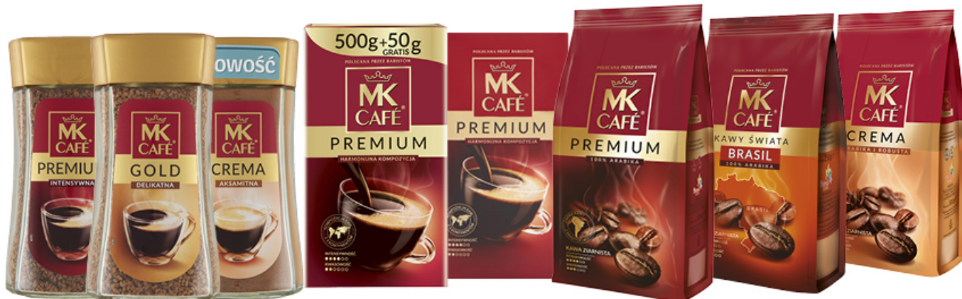
KAWA MK CAFE 130 / 175 / 250 / 500 / 550 g