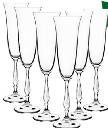
KIELISZKI TOSCANIA SZAMPAN 190 ml 6 szt.