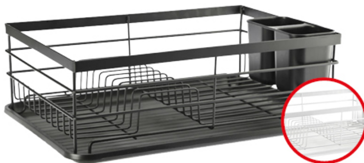
SUSZARKA DO NACZYŃ NICOLA