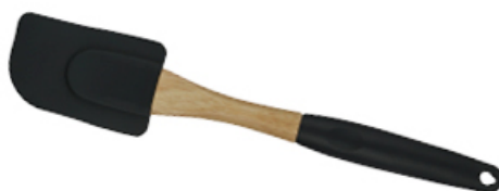
ŁOPATKA SILIKONOWA SCANDI