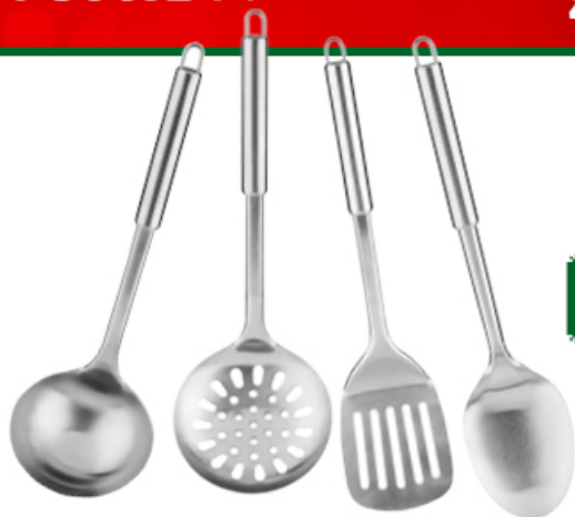
NABIERKA/ ŁYŻKA SZUMÓWKA/ ŁOPATKA DO MIĘSA/ ŁYŻKA NIERDZEWNA PRACTICO