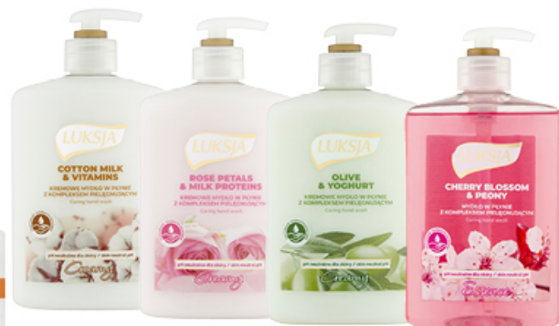
MYDŁO W PŁYNIE LUKSJA 500 ml CHERRY BLOSSOM & PEONY, OLIVE & YOGHURT, ROSE PETALS & MILK PROTEINS, COTTON MILK & VITAMINS, PZ CUSSONS