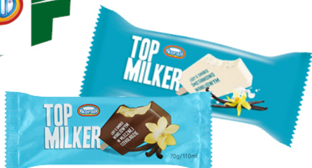
LODY TOP MILKER 110 ml

WANILIOWY W MLECZNEJ CZEKOLADZIE, ŚMIETANKOWO WANILIOWY KORAL