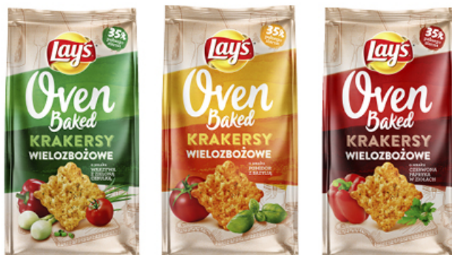
KRAKERSY LAY'S OVEN BAKED 80 g