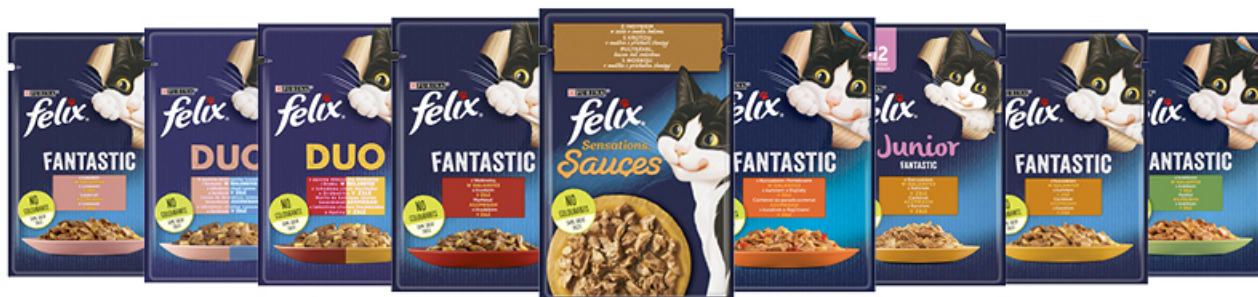
KARMA FELIX 85 g