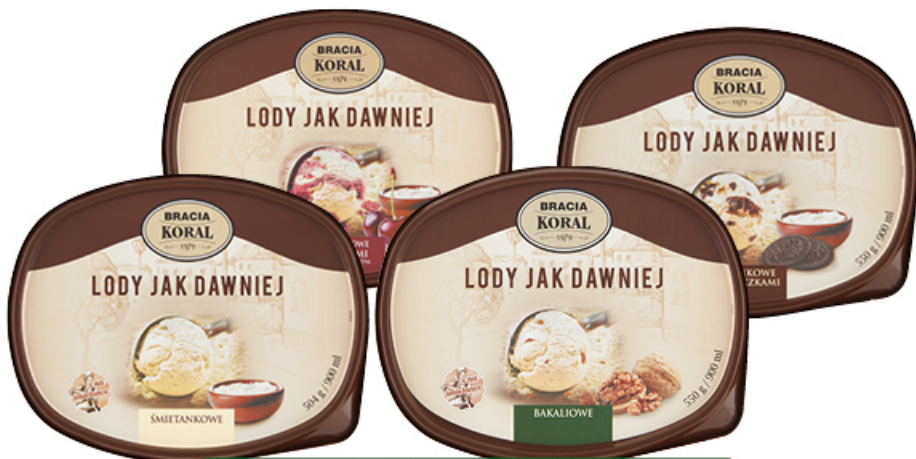
LODY JAK DAWNIEJ BRACIA KORAL 900 ml

WANILOWE, ŚMIETANKOWE, ŚMIETANKOWE Z CIASTECZKAMI, ŚMIETANKOWE Z WIŚNIAMI I SOSEM WIŚNI, BAKALIOWE KORAL