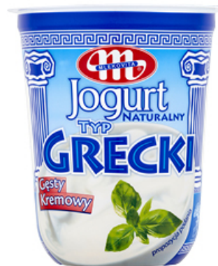
JOGURT NATURALNY TYP GRECKI 400 g MLEKOVITA