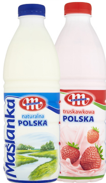
MAŚLANKA POLSKA 1000 g