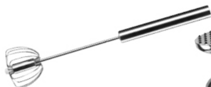
UBIŁAK OBROTOWY MAŁY