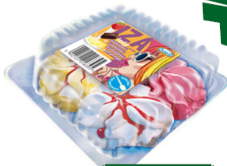
LODY IZA 270 ml

ŚMIETANKOWO-TRUSKOWO-CYTRYNOWO-CZEKOLADOWE KORAL