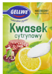
KWASEK CYTRYNOWY GELLWE 20 g