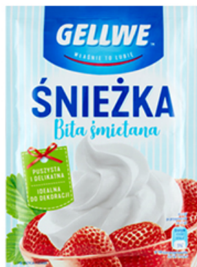
BITA ŚMIETANA ŚNIEŻKA GELLWE 55 g