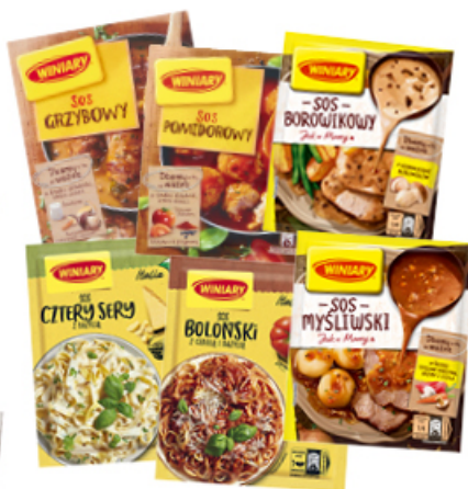
SOS WINIARY 27 - 46 g