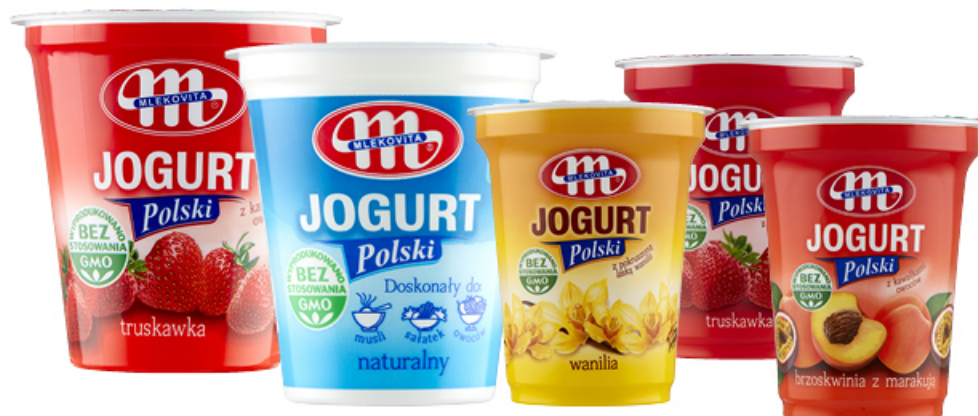
JOGURT POLSKI 150 / 350 g WYBRANY ASORTYMENT MLEKOVITA