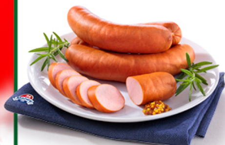
PARÓWKOWA MAZURY ELK