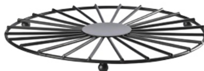
PODKŁADKA METALOWA TOGO