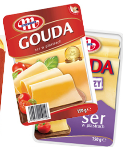
SER PŁASTRY 150 g