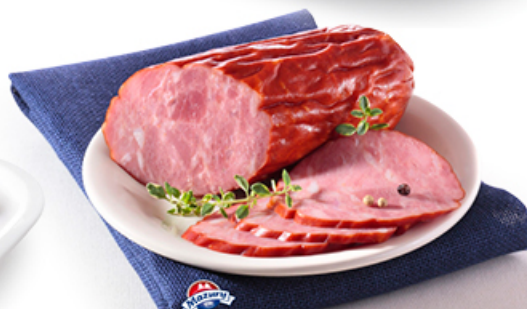
KIELBASA ŻYWIECKA ELK