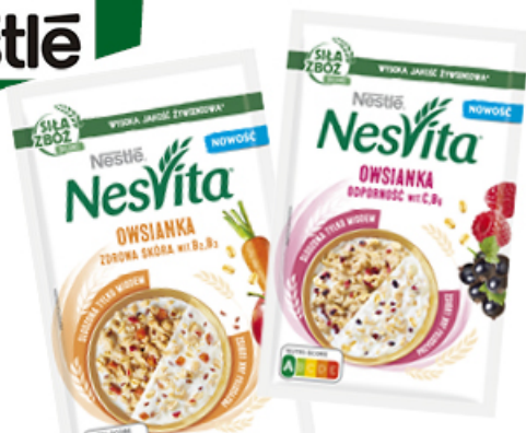
OWSIANKA NESVITA 35 g ODPORNOŚĆ, ZDROWA SKÓRA NESTLÉ