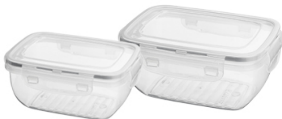
POJEMNIK PROSTOKĄTNY FRESCO