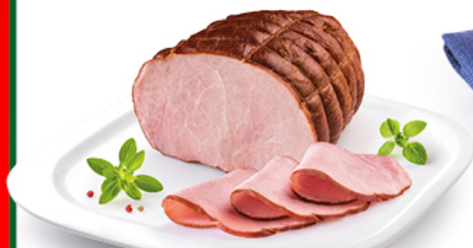
SZYNEK MORLIŃSKA MAZURY ELK