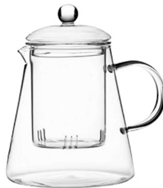
DZBANEK Z ZAPARZACZEM LEONARDO 1 L