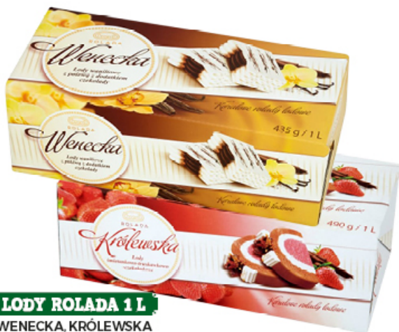
LODY ROLADA 1 L