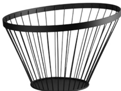
KOSZYK METALOWY COLLET