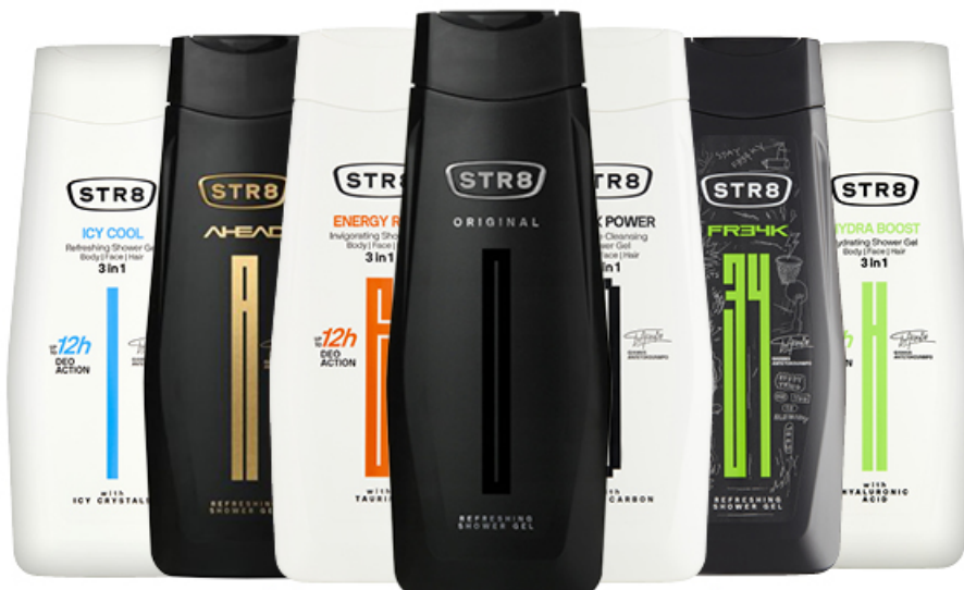
ŻEL POD PRYSZNIC STR8 400 ml

SARANTIS POLSKA Great brands for everyday