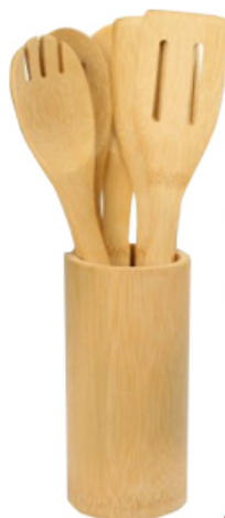
ZESTAW PRZYBORÓW KUCHENNYCH Z BAMBUSA 6 ELEMENTÓW

DO WARZYW/12 cm/17 cm/ UNIWERSALNY/OBIERAK RAVI