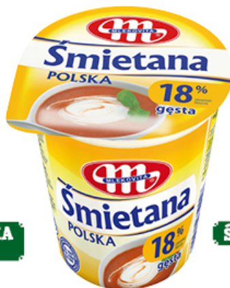
ŚMIETANA POLSKA 18% 400 g