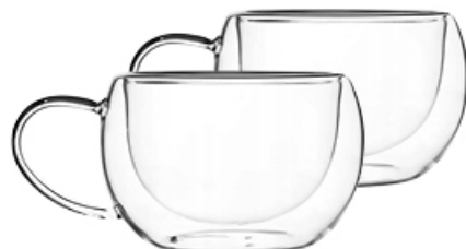
FILIŻANKA DUO 280 ml 2 szt.