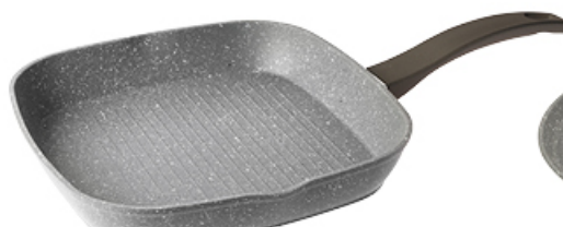
PATELNA GRILLOWA STONE 26 cm