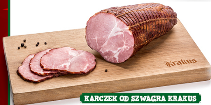
KARCZEK OD SZWAGRA KRAKUS