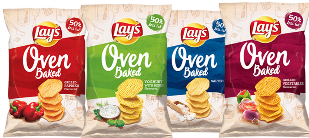
CHIPSY LAY'S OVEN BAKED 125 g