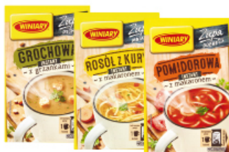
ZUPA INSTANT WINIARY 12 / 17 / 21 g