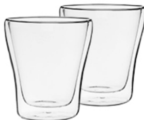
SZKLANKA DUO 250 ml 2 szt.