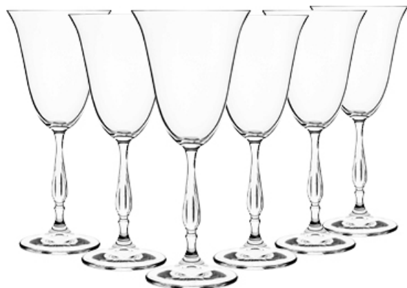
KIELISZKI TOSCANIA WINO 250 ml 6 szt.