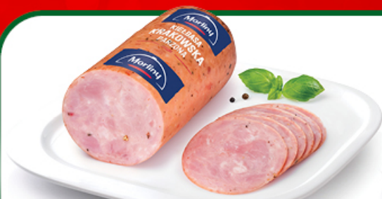
KIELBASA KRAKOWSKA PARZONA MORLINY