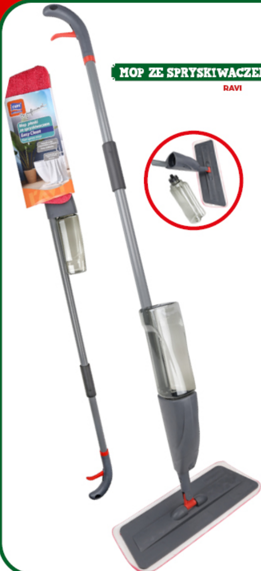
MOP ZE SPRYSKIWACZEM EASY CLEAN