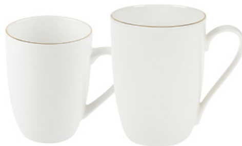
KUBEK ORO Z PORCELANY NEW BONE