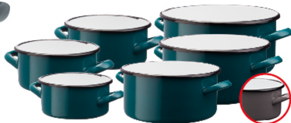
RONDEL EMALIOWANY GŁADKI GUSTO SZARY/ TURKUSOWY

14 cm 1 L/16 cm 1,5 L/18 cm 2 L/20 cm 3 L/22 cm 4 L/24 cm 5 L