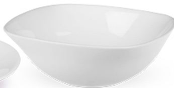
SALATERKA QUADRO 19 cm