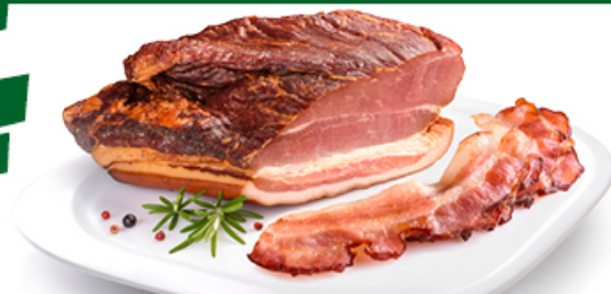
BOCZEK MORLIŃSKI WĘDZONY MORLINY