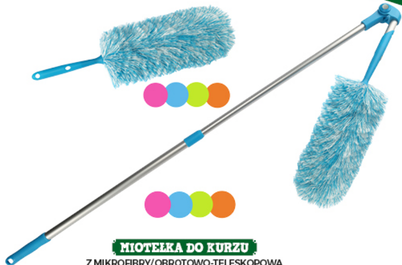
MIOTEŁKA DO KURZU