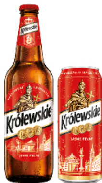
PIWO KRÓLEWSKIE 0,5 L