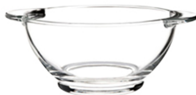
BULIONÓWKA 500 ml