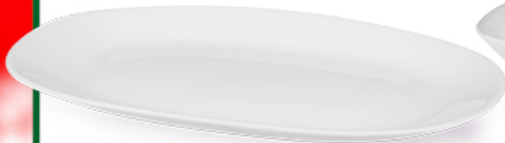
PÓLMISEK QUADRO 23 x 16,5 cm