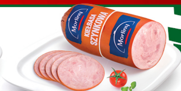
KIELBASA SZYNEKOWA MORLINY