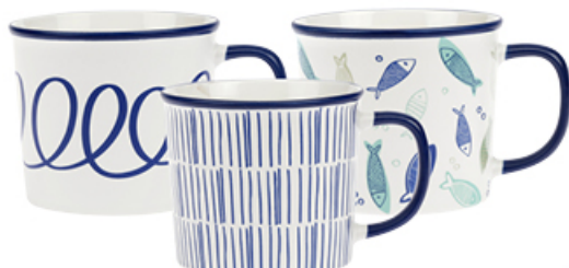
KUBEK ARTE Z PORCELANY NEW BONE 320 ml